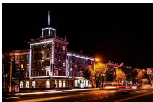
Вечерний Луганск. Дом со шпилем