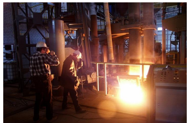
Алчевск. Алчевский металлургический комбинат