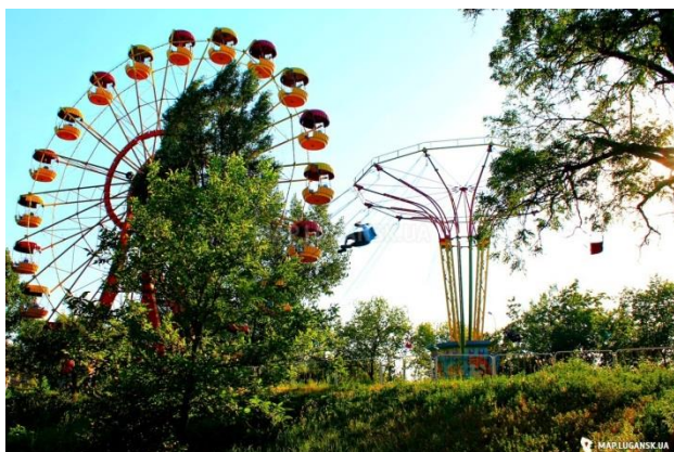
Парк 1 мая